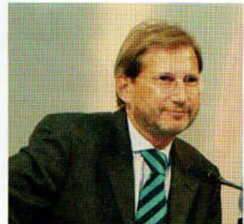
Bundesminister Johannes Hahn – absolviert er noch eine Amtsperiode, darf man gespannt sein, ob für eine Verbesserung beim Doktoratsstudium überhaupt Geld in der Kassa sein wird

Übrigens: Es gibt auch Programme, die mindestens vier Jahre für die Titelerreichung vorsehen, etwa jenes PhD-Programm mit dem Schwerpunkt Finanzwirtschaft an der Wirtschaftsuniversität Wien, das gemeinsam mit dem Institut für Höhere Studien angeboten wird, acht Semester umfasst und